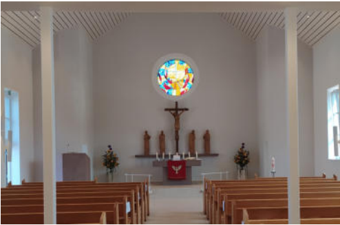
Das Fenster an seinem Platz in der Kirche...

Am 7. April 2020 wurde der erste Spatenstich auf dem 5.500 m 2 großen Grundstück vorgenommen.