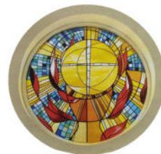
... und hier nochmal alleine