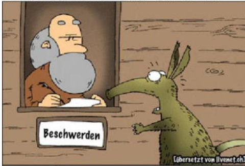
Zwei Ameisen? Du hast nur zwei Ameisen? Meine Frau und ich essen ungefähr 100'000 pro Tag! siehe Genesis 6-8

Die Brüder Tim und Tom sprechen vor dem Zubettgehen ihre Gebete. Am nächsten Tag hat Tim Geburtstag, und er schreit beim Beten ganz laut: „Gott, bitte bring mir ein neues Fahrrad, einen Laptop und ein ferngesteuertes Auto!“ Tom sagt darauf zu Tim: „Warum schreist du so? Der liebe Gott ist doch nicht schwerhörig!“ – „Nein“, erwidert Tim, „aber Oma!“